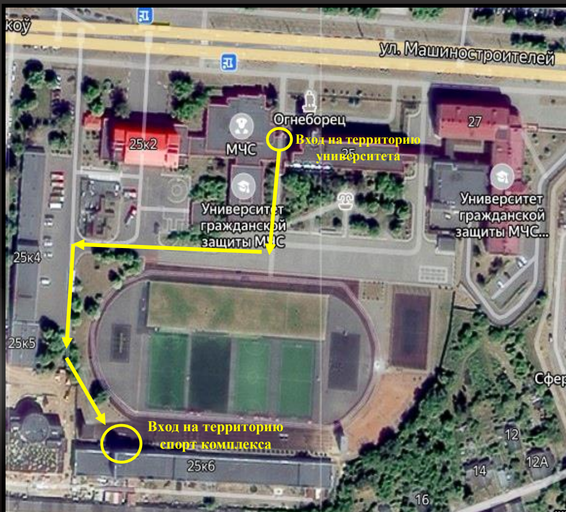
СХЕМА ДВИЖЕНИЯ ПО ТЕРРИТОРИИ

Вход на территорию УГЗ будет возможен при наличии документов удостоверения личности и специальных браслетов. Списки на проход подаются в ГСК.